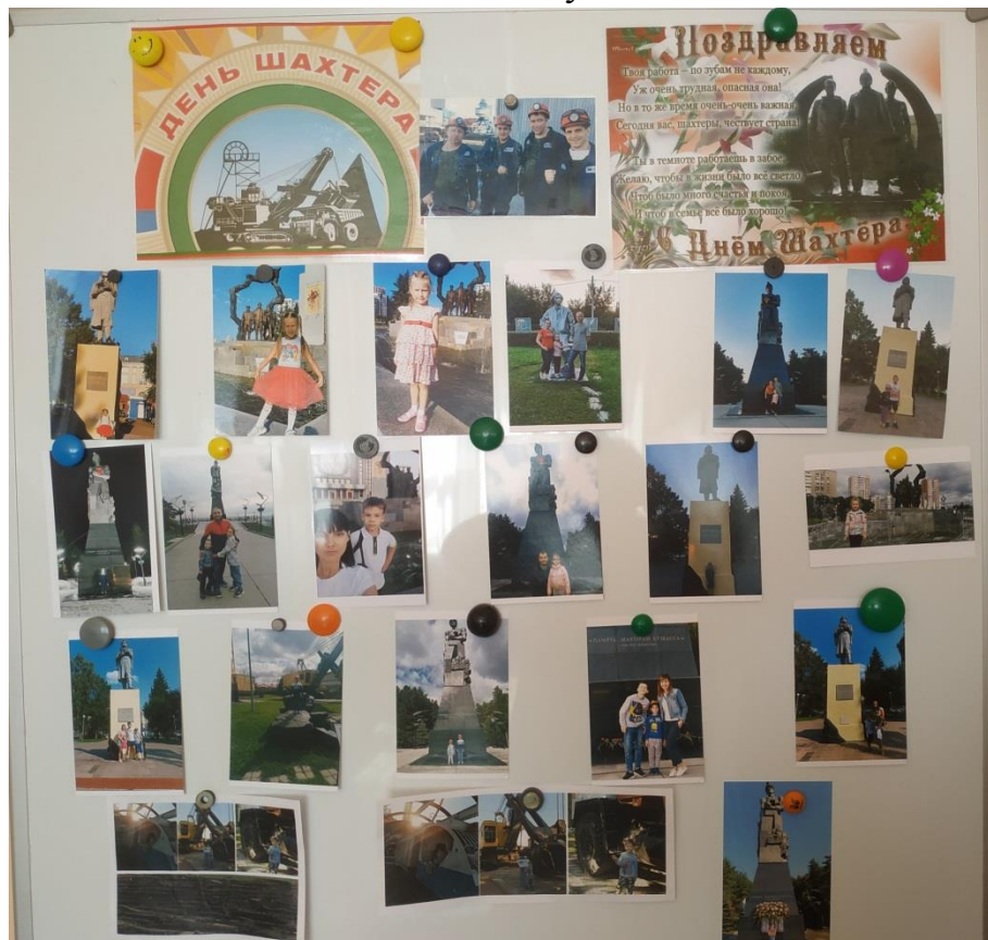
«Кузбасс- Шахтерский край»