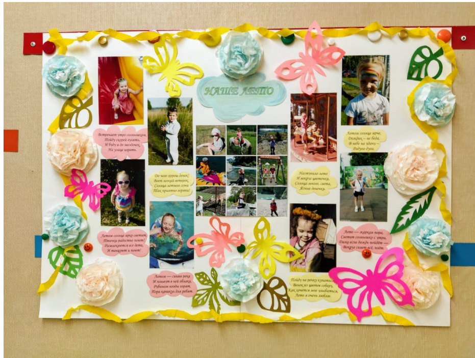
«Лето в Родном Кузбассе»