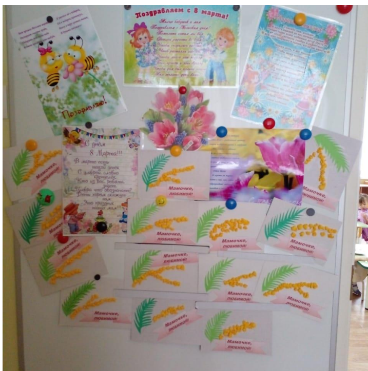
8 МАРТА «Это- Мамин день!»