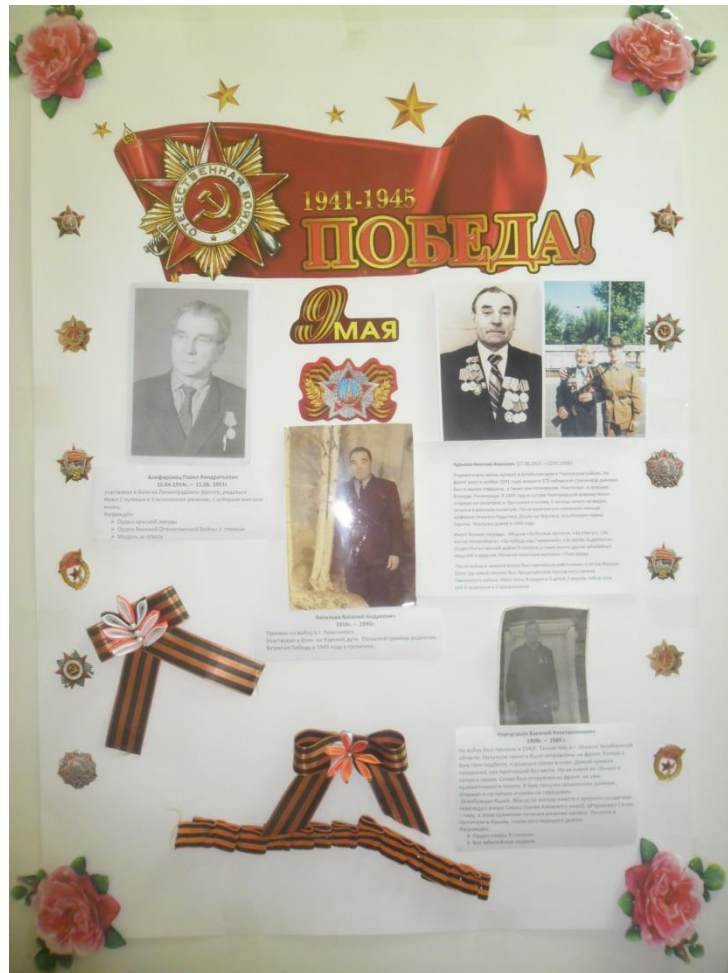
Совместный проект с родителями «Спасибо прадеду за Победу!»